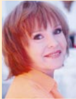
Berlin: Katrin Sass