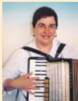
B, Begine: Gulich