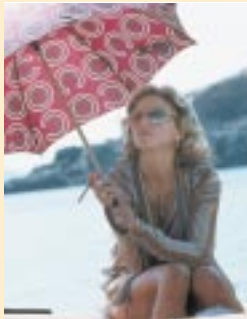
Köln: Madonna Party