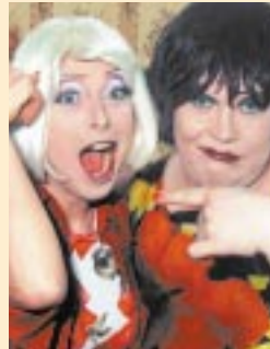
Köln: Die Lottis