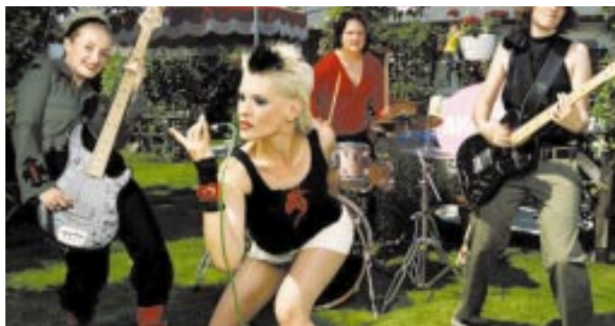
Frankfurt: Changes, AK4711

20-23.00 Frauenberatungsstelle, Frauencafé: es wird gekocht (Info unter 0211-354807)