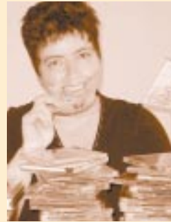
B, Begine: Qual der Wahl