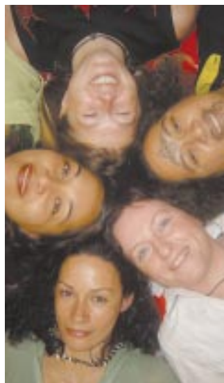
Berlin: Planet Woman

AUGSBURG 20.30 Frauenzentrum: Freitaglesbenkneipe