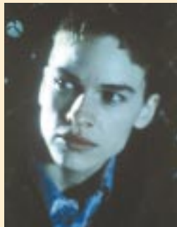
Boys Don't Cry