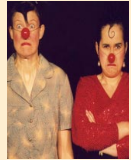
Hamburg: Prima Panna