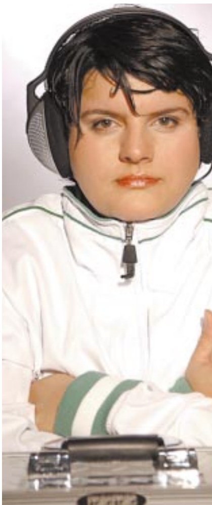
Hamburg: Fun Club, DJ Central